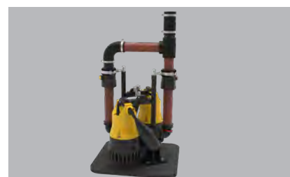
Pompe non incluse nel set