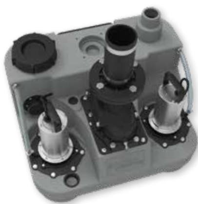
833 x 594 x 619 mm (L x H x P)

L'impianto è conforme alla norma europea (EN 12056 Parte 4), secondo la quale l'uso di sistemi doppi è obbligatorio nei condomini e negli immobili commerciali dove non deve essere interrotto il flusso delle acque reflue.